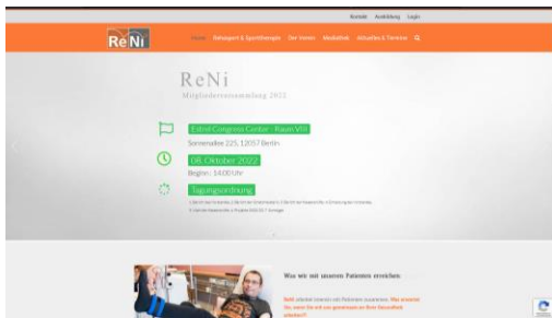
Abb.: Einladung Internet und postalische Zusendung